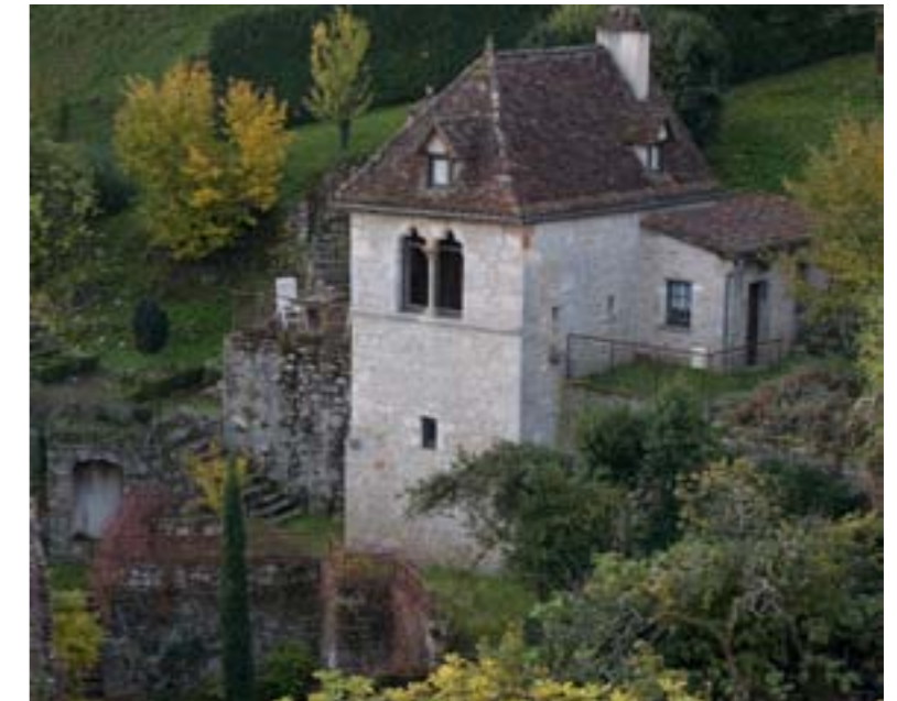
3 Atelier, Maisons Daura