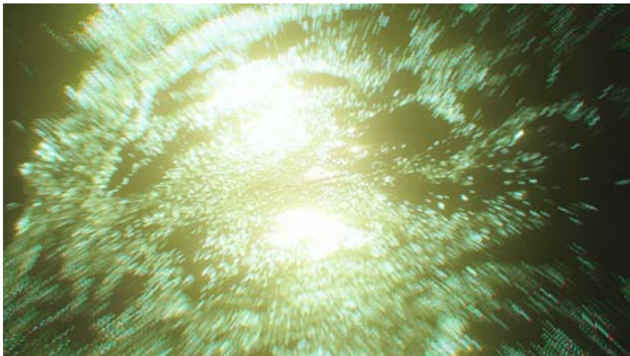
LUDWIG SWIMMING THE RINGS OF A GAS GIANT Photographie numérique dimensions variables