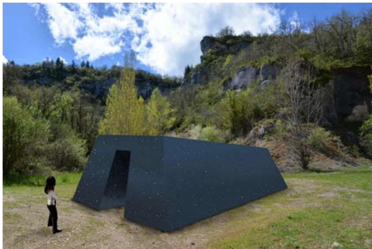
CAROLINE LE MÉHAUTÉ Negotiation 82 - Meta 2016 Bois, fibres optiques, générateurs 300 x 500 x 800 cm image : montage numérique