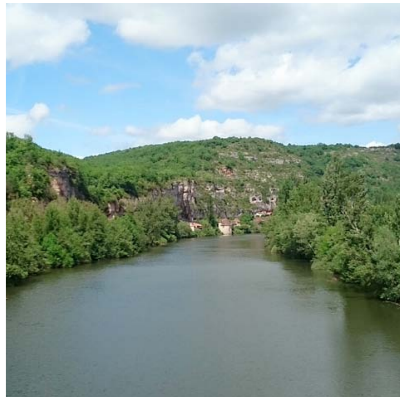
La vallée du Lot

SUR PLACE GÂTEAUX, THÉ, CAFÉ EN PRIX LIBRE, PAR LE CHRS L'AUBERGE.